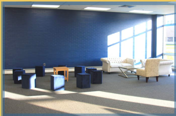
Sảnh học sinh