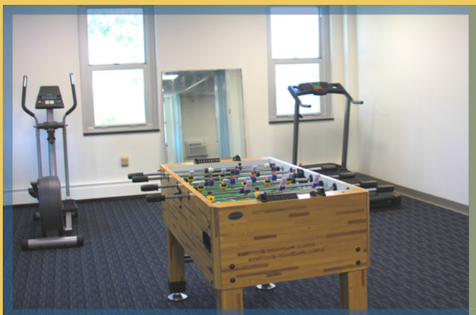
Phòng hoạt động