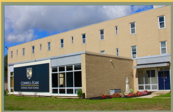
Cảnh bên ngoài Ký túc xá