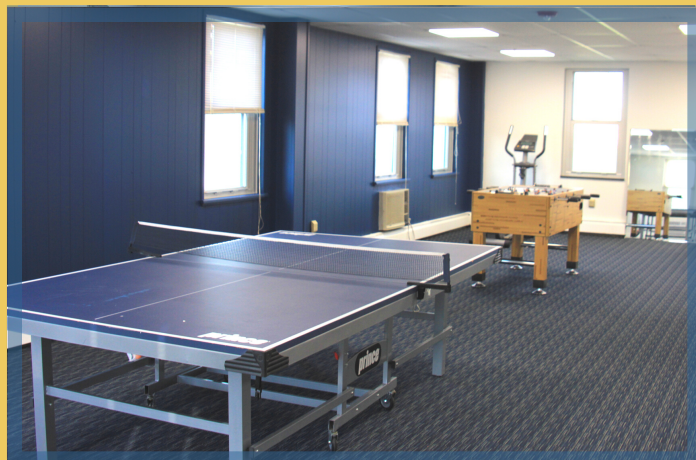
Phòng hoạt động