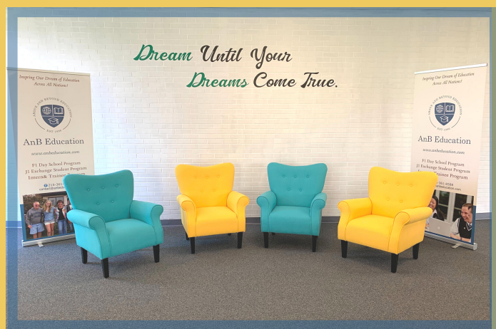
Sảnh học sinh