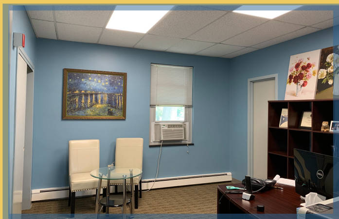
Trụ sở AnB