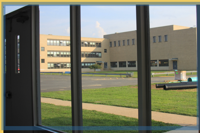
Quang cảnh trường đôi diện Ký túc xá