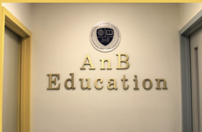
Trụ sở AnB